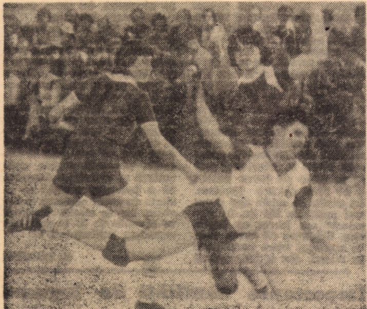
Coșulschi (C.S.M.) trage și înscrie