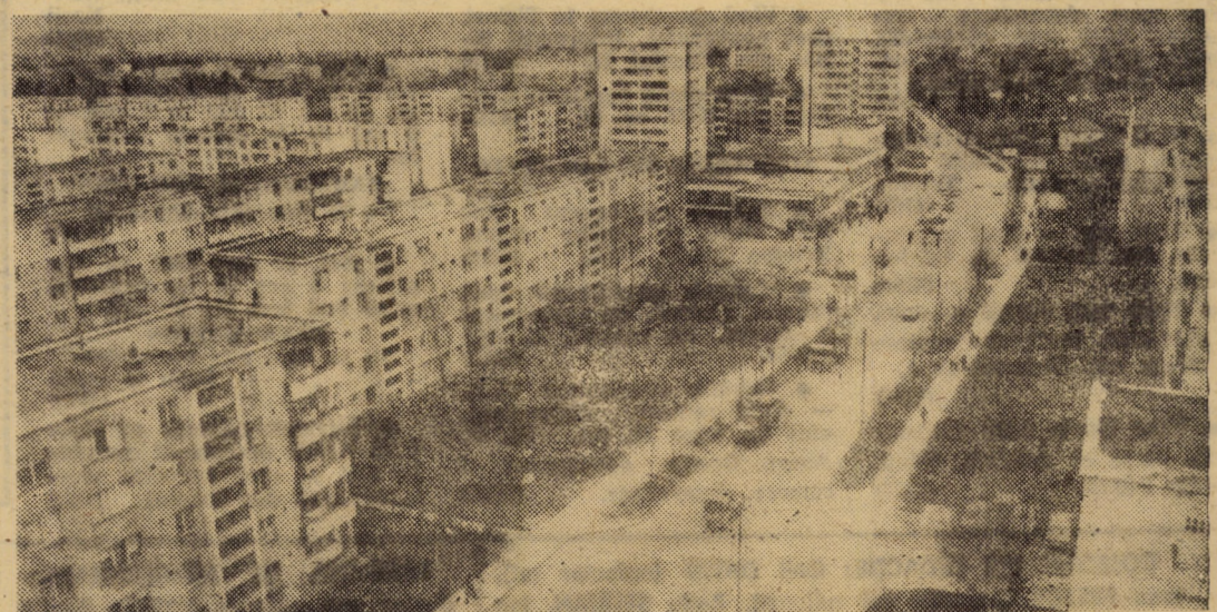
Aspect din cartierul de locuințe Hipodrom I Sibiu

Atunci nu știu nici eu de ce am devenit sentimental, eu care seara apăsam pe butonul televizorului și puteam să-i văd, într-o clipă, pe cei mai mari artiști ai lumii. Mi-a fost rușine poate că n-am tresărit înfiorat alături de pădureni la cîntecul ceterii. Vreau acum să imi fac o datorie de suflet din a cere celor care se ocupă cu exploatarea forestieră să sprijine lucrătorii pădurii cu muzică. Acolo, în munții noștri, care sînt mari și puternici ca oamenii.