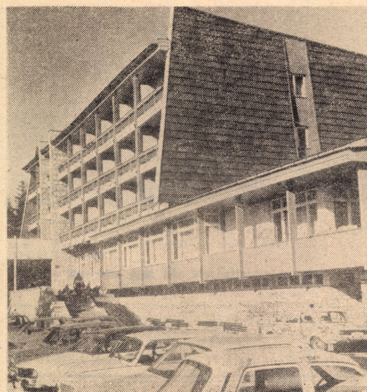
Din arhitectura modernă a Stațiunii climatice Păltiniș: hotelul „Cindrelul”

26.V: • La Casa pionierilor și șoimilor patriei din Sibiu va avea loc instruirea cu tema: „Cum ajutăm cadrele didactice în organizarea activităților de informare politică a șoimilor patriei”. Participă comandanți-instructori pentru șoimii patriei de la școlile din municipiu. 27.V: • „Copilăria noastră fericită” este genericul expoziției care se deschide la Casa pionierilor și șoimilor patriei din Avrig, cuprinzînd lucrări realizate de membrii atelierelor casei. • Pionierii membri ai cercurilor de dezbateri politice de la Casa pionierilor și șoimilor patriei din Mediaș vor vizita întreprinderea „Tirnavă” și se vor întîlni cu uteciștii, în cadrul unei dezbateri pe probleme ale vieții și activității organizațiilor de tineret. 28.V: • „Scriitorul meu preferat” este tema concursului la care vor participa membrii cenaclului literar al Casei pionierilor și șoimilor patriei din Avrig, urmat de un recital de poezie patriotică. • În zilele de 29 și 30 mai, la Săliște și Sibiu se va desfășura faza județeană a concursului de aer, racheta și navomodele. 30.V: • Consiliul municipal Sibiu al organizației pionierilor organizează un concurs de orientare turistică și „Cupa pionierului” la înot. 31.V: • În toate unitățile de pionieri se vor desfășura serbări și spectacole pionierești dedicate zilei de 1 Iunie.