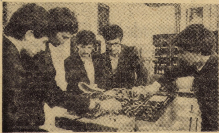
Acum, la sfîrșit de an școlar, elevii clasei a XII-a B de la Liceul industrial nr. 1 Sibiu își pregătesc cu sîrguință lucrările practice de diplomă. În fotografie: studiu asupra curentului alternativ în laboratorul de electronică.