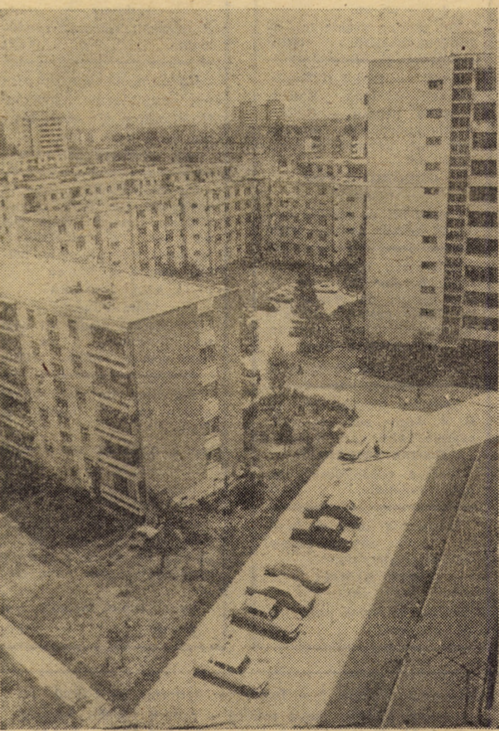
Urbanistică sibiană, privită de la etajul 10 în cartierul Hipodrom