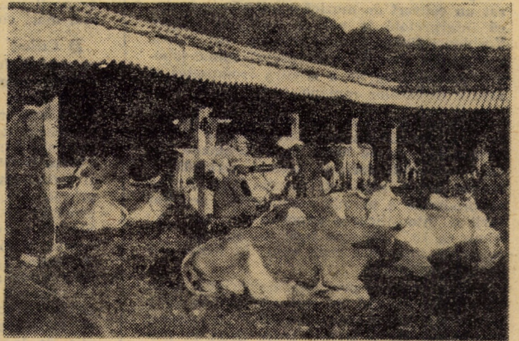
Odată cu revărsatul zorilor, în taberele de vară ale C.A.P. Șura Mare se desfășoară o activitate febrilă. Inghijitorii încep mulsul de dimineață în prezența șefilor de fermă și a operatorilor însămintători. De menționat și faptul că în unitatea amintită, în ultima perioadă de timp, producția de lapte pe vacă furajată a sporit de la 4,3 litri la 6,5 litri.