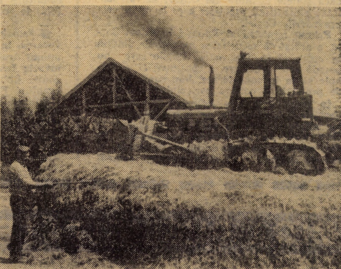
La ferma Ruși a I.A.S. Slimnic se acționează din plin zilele acestea la recoltatul și depozitul furajelor. Aici se acordă mare atenție înlocuirii semînului. Imaginea surprinde momentul tasării semînului în locul special amenajat.

Avem în aceste exemple dovada elocventă a modului în care colectivele de oameni ai muncii din municipiul Medias înțeleg să aplice în practică imperatiile și sarcinile etapei actuale. Așa cum a fost demarată acțiunea și primele rezultate obținute ne dau garanția că sarcinile trasate de conducerea de partid și de stat vor fi îndeplinite în totalitate.