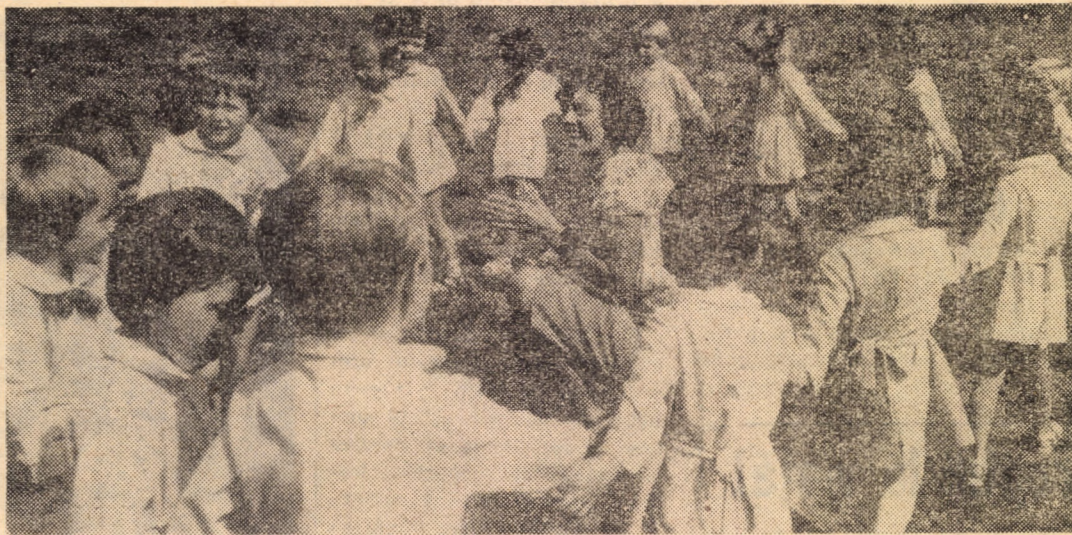
Beneficiind de zilele frumoase, copiii grădiniței din cartierul „Vasile Aarón” din Sibiu zburdă în aerul proaspăt.

Mîine, 19 iunie 1982, ora 9, la Casa de cultură a sindicatelor din Sibiu, sala Studio, are loc simpozionul cu tema: „Aspecte juridice, economice și tehnice, privind organizarea și funcționarea unităților socialiste de stat, pe baza autoconducerii muncitorești și autogestunii economico-financiare”.