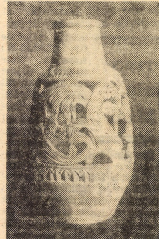
Ioan Răfa (vas decorativ) — ceramică

cole de staț și cooperative agricole de producție. Aceasta asigură, pe de o parte păstrarea unui permanent contact cu realitățile politice, economice și sociale ale județului, cu viața și preocupările cotidiene ale oamenilor muncii, români, germani, maghiari, iar pe de altă parte constituie cel mai adecvat și bogat izvor de inspirație pentru creatorii de frumos. Este pozitiv, de asemenea, faptul că