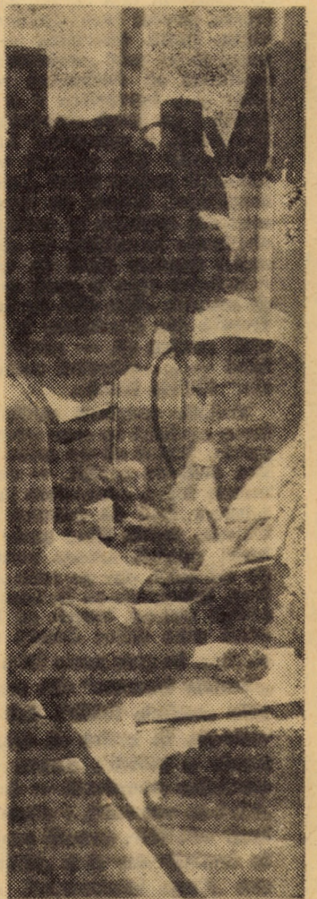
Oră de instruire practică în laboratorul de tehnică dentară la Liceul sanitar Sibiu

În cadrul schimbului cultural româno-american „Ambasadorii prieteniei” două formații artistice americane prezintă următoarele spectacole: ● Luni, 28 iunie a.c., ora 19,30, aula Liceului de matematică-fizică nr. 1 din Sibiu: concertul corului de copii Sing's Of Sunrise dirijat de Gail Parker din Camden-Main. ● marți, 29 iunie a.c., ora 19,30, Casa de cultură a sindicatelor din Sibiu: concertul orchestrei simfonice New England Conservatory Youth Chamber Orchestra dirijor Benjamin Sander. (D.G.)