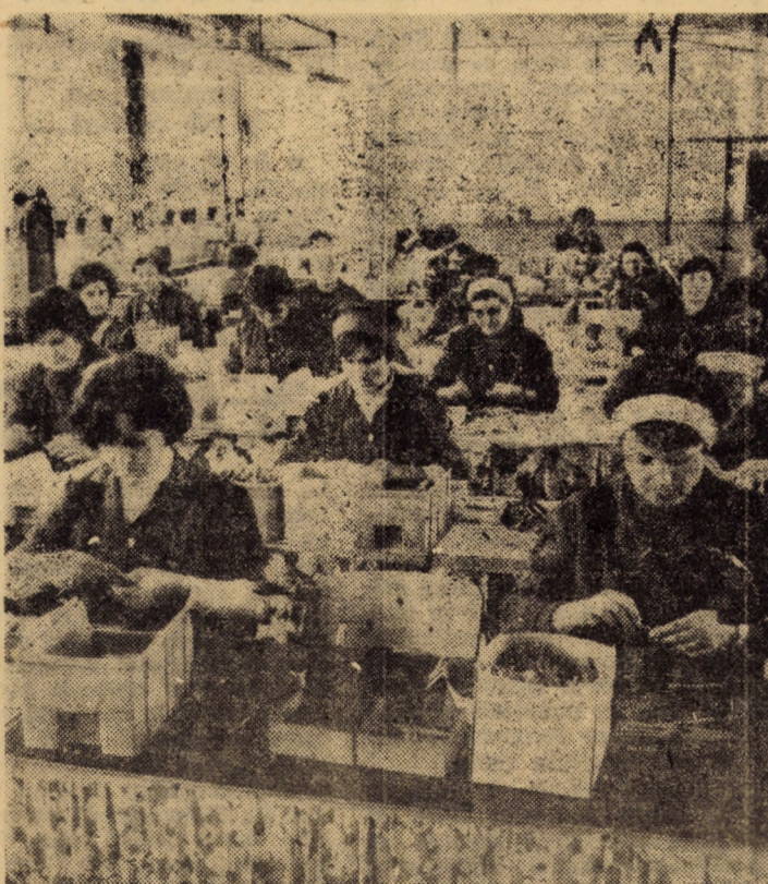
Pentru bunele rezultate obținute, atelierul montaj articole de scris se menține printre compartimentele fruntașe din cadrul întreprinderii „Flamura roșie” Sibiu