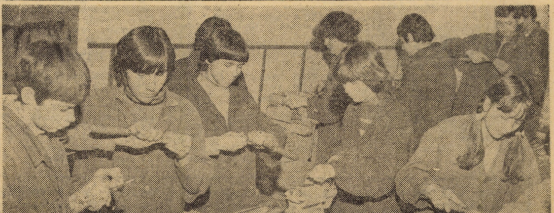
Practică productivă în atelierul de lăcătușărie al Liceului nr. 1, matematică-fizică, Sibiu unde elevii clasei a IX-a B execută lucrări în colaborare cu I.P.A.S. Sibiu