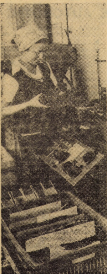
Întreprinderea „Flamura roșie” Sibiu, atelierul de umplut mine cu pastă. Producția zilnică a acestui compartiment se ridică la peste 250 000 mine de diferite culori

(Continuare în pag. a III-a) Interviu consemnat de LUCIAN JIMAN