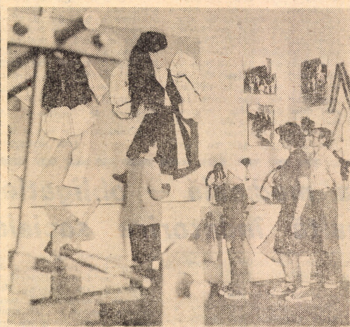
Interior din Muzeul etnografic din Rășinari

Iată, asadar, cîteva din problemele deloc ușoare ce trebuie soluționate prioritar de către colectivul medieșean. Trebuie spus că unele măsuri de (re)organizare a muncii în serviciile operaționale și în secțiile de producție au și fost luate. În continuare se caută febril soluții în colaborare cu specialiștii centralei, cu alți specialiști locali (sperăm să-i putem include aici și pe cei ai I.P.L. Sibiu, care au datorria morală să-și ajute în continuare colegii de breaslă). S-a realizat, adică, o masivă concentrare de forțe care trebuie să rodească. Să urăm asadar succes colectivului medieșean pe noul drum pe care a pășit.