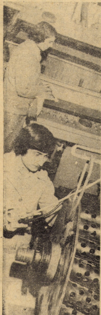
Finisarea chimică a produselor din cristal la întreprinderea „Sticla” Avrig.

Specialiștii întreprinderii „Mecanica” din Sibiu, proiectanți și executanți, sînt angajați plenar în marea și importanta acțiune de reducere a importurilor. Dintre ultimele succese înregistrate în acest domeniu avem astăzi ocazia să consemnăm asimilarea și realizarea a 6 prese hidraulice de 100 t.f., necesare unei întreprinderi din Urziceni (înlocuindu-se astfel utilaje similare din import valorînd 7 milioane lei) și două prese pentru polimerizare la cald și la rece (fiecare valorînd cite un milion lei dacă s-ar fi importat), livrate unei întreprinderi din Rimnicu Sărat.