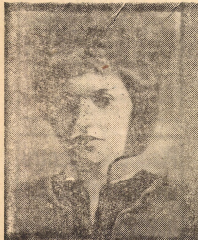
MARIUS DAVID: „Ana” (ulei)