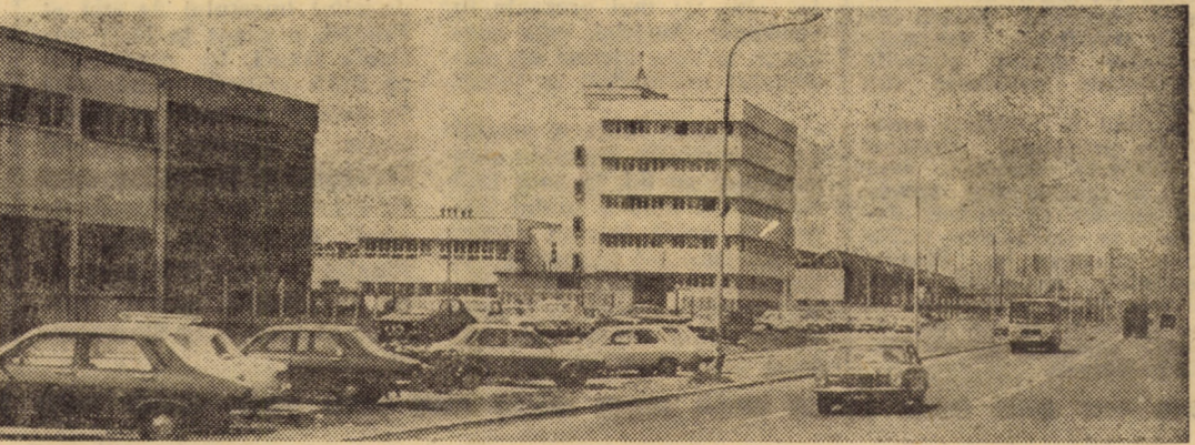
Din peisajul industrial al Sibului — platforma est

Datele înfățișate mai sus creionează concludent imaginea unui județ puternic industrializat care, grație politicii științifice a partidului și statului în domeniul dezvoltării, ale cărei baze au fost puse de către Congresul al IX-lea al partidului, de gândirea politică înțeleaptă și clarvăzătoare a secretarului general al partidului, tovarășul Nicolae Ceaușescu, și-a croit în mai puțin de două decenii un nou destin socialist, adăugând „tradiției” zestrea a numeroase noi și moderne cetăți ale producției, dotate cu mașini și utilaje de cea mai înaltă tehnicitate, deservite de un destoinic detașament muncitoresc.