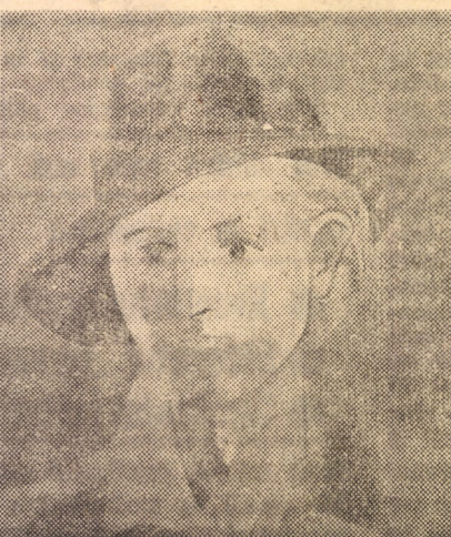
AURELIAN DINULESCU: „Tonia” (ulei)