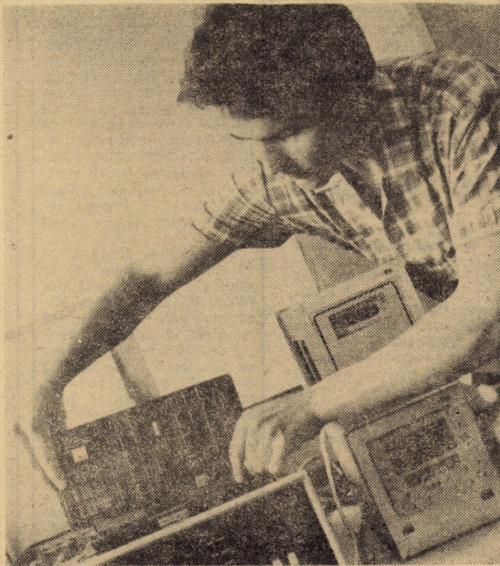
Reparații la timp și de bună calitate — atribute ale tehnicienilor cu o înaltă calificare de la Întreprinderea pentru întreținerea și repararea utilajelor de calcul și electronică profesională București, filiala Sibiu

În conformitate cu noile orientări în producția de mobilier de toate tipurile, pînă la data de 15 septembrie a.c. urmează a fi reproiectate toate produsele din producția de serie. Se are în vedere ca noile modele rezultate în urma acestei mari acțiuni să încorporeze cu 40 la sută mai puțină masă lemnoasă (la intern), respectiv 30 la sută la modelele destinate exportului, urmărindu-se în paralel realizarea unor produse mai ușoare. Înclusiv reducerea greutateii produselor ambalate pentru export cu 40 la sută.