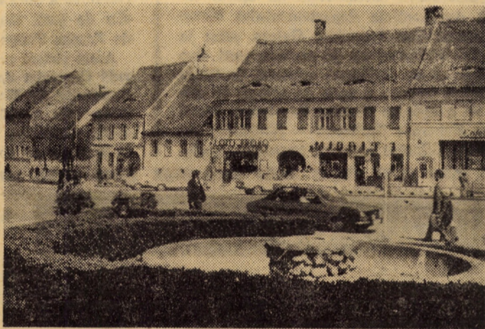
Orașul textilistilor - Cisnădie - se înscrie azi printre localitățile bine gospodărite ale județului

În încheierea adunării cetățenești, tovarășul Vasile Bărbuleț a punctat principalele sarcini ale consiliilor populare, ale factorilor de răspundere de la nivelul județului în perioada imediat următoare: ● necesitatea realizării integrale a sarcinilor din industrie, agricultură și a obiectivelor edilitar-gospodărești în fiecare localitate; ● realizarea unor produse de înaltă calitate în toate sectoarele de activitate; ● luarea urgentă de măsuri pentru a instaura ordinea și curățenia în toate localitățile, în toate unitățile economice; ● mobilizarea generală a locuitorilor în campania de strângere și depozitare a recoltei; ● recoltarea griului de pe întreaga suprafață cultivată, în ceș mult 10 zile.