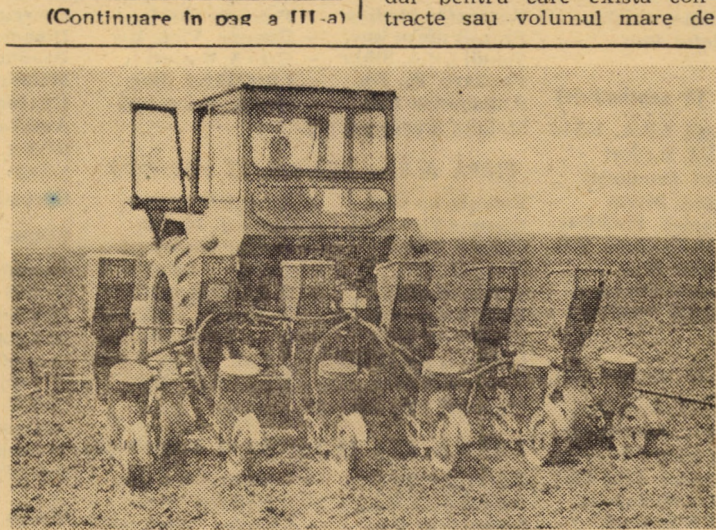
După eliberarea de paie a suprafețelor recoltate, pe majoritatea terenurilor se însămîntează imediat culturi duble