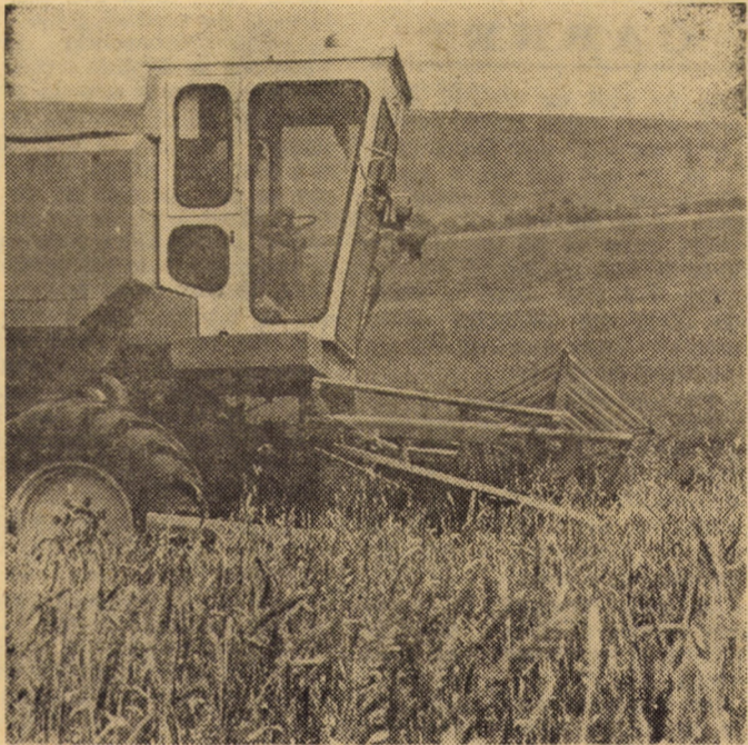
Pe terenurile C.A.P. Miercurea Sibiului, secerișul grâului se desfășoară zilele acestea din plin