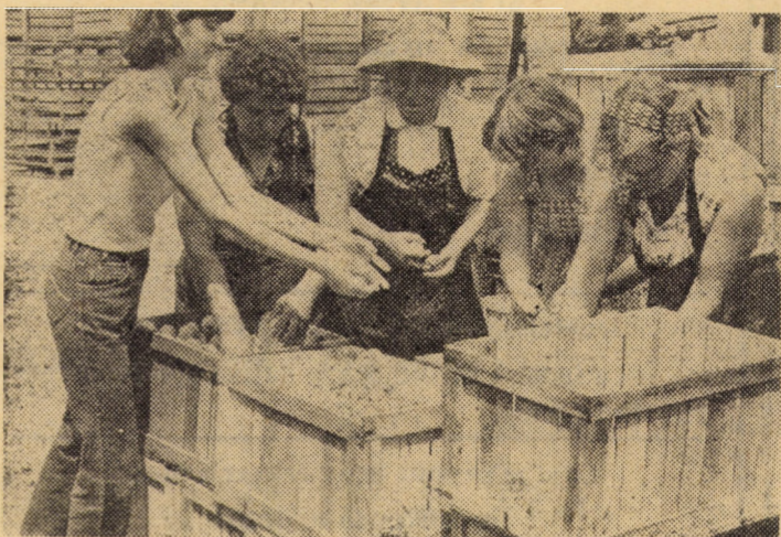
Activitate susținută la sortarea merelor în Ferma pomicolă nr. 5, a I.A.S. Apoldu de Sus