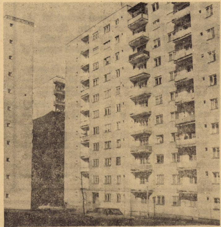
Din peisajul cartierului „După Zid” din municipiul Medias

Poziția consecventă a României pentru extinderea conlucrării între toate națiunile, este susținută de eforturile permanente și constante ale partidului și statului nostru pentru renunțarea la măsurile economice discriminatorii, la dobinzile înalte, pentru dezvoltarea de relații de colaborare pașnică între toate statele. Aceste eforturi cunosc o largă apreciere și recunoaștere pe plan internațional, deoarece au la bază respectarea principiilor deplinei egalități în drepturi, respectul independenței și suveranității naționale, neamestecul în treburile interne, renunțarea la forță și amenințarea cu forța, respectarea dreptului fiecărui popor la dezvoltare liberă, a dreptului sacru al fiecărei națiuni de a-și alege orînduirea socială pe care o dorește.