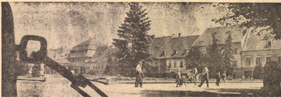
Piața Republicii din Sibiu, înconjurată de construcțiile sale specifice, declarate aproape în întregime monumente istorice

• EXPOZIȚII MEDIESENE. Pentru turiștii aflați în vizită la Medias în perioada sezonului estival, rețeaua expozițiilor locale poate întruni toate atribuțiile unei oferte... tentante. Iată câteva amănunte despre conținut și program de vizitare: Turnul aurilor găzduiește o expoziție de istorie medievală cu arme de luptă și obiecte muzeistice ilustrând vechiul sistem de apărare al cetății precum și aspecte legate de activitatea breslelor medesene (program: zilele de joi și duminică, între orele 9-17); expoziția etnografică „Ocupațiile tradiționale din zona Tîrnavelor” poate fi vizitată în Turnul pietrarilor (program: joi și sâmbătă, între orele 10-14); muzeul vă invită să vizionați expozițiile de ceramică, port popular, arheologie, inclusiv noua expoziție cu obiecte de cositor aparținând breslei stănarilor.