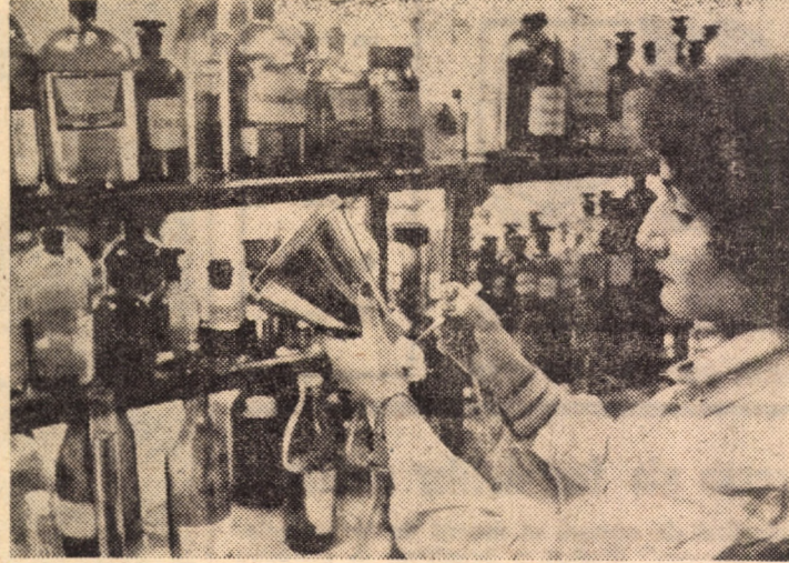
Determinarea calității vinurilor în laboratorul de analize al Întreprinderii viei și vinului Sibiu