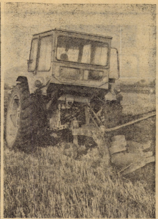
Arăturile de vară ocupă un loc important în tehnologia producerii cerealelor. De îndată ce terenurile au fost eliberate de paie, intră plugurile ce întorc brazdă nouă pentru conservarea rezervelor de apă din sol. În imagine: în fapta serii la arat pe terenurile C.A.P. Cornățel