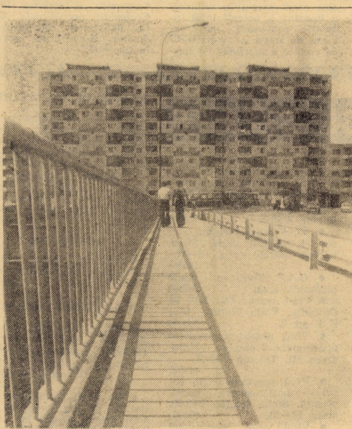
Spre cartierul sibian „Vasile Aaron“

Desigur, grija pentru calitatea producției s-a resimțit și din cuvîntul celorlalți participanți la discuții, dar noi vom mai reține, pentru finalul acestor rînduri, dorința unanimă a oamenilor muncii de la întreprinderea „13 Decembrie“, exprimată prin reprezentanții lor, de a-și permanentiza un loc frunțos în întrecerea socialistă.