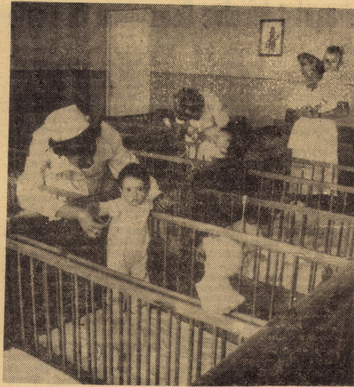
Intr-unul din saloanele Creșei nr. 40, Sibiu, (str. Oituz), aparținînd întreprinderii „Balanța”, copiii se bucură de o bună îngrijire

La omologarea seriei zero — de asemenea, exigență maximă în ceea ce privește caracteristicile realizate de produsele executate cu echipamentul tehnologic complet; nivelul rebuturilor și pierde-