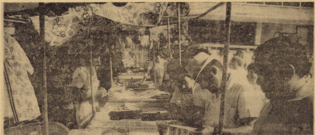
Comerțul stradal, practicat cu succes și în municipiul Sibiu, vine în întîmpinarea cumpărătorilor grăbiți, avînd totodată o importantă contribuție la realizarea planului de vânzări. Iată, în fotografie, tonetele din fața magazinului „Dumbrava” prin care, numai în luna iulie a.c., au fost vîndute mărfuri în valoare de peste 650 000 lei