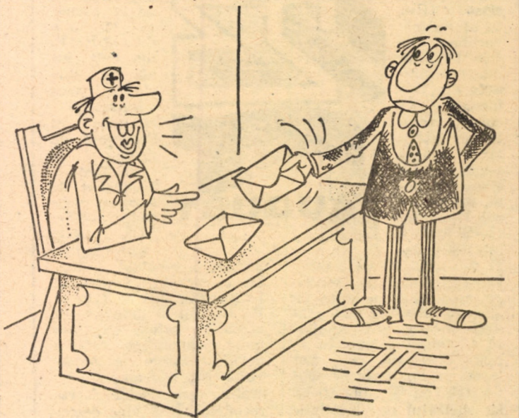
Perfect! În care plic sînt analizele!? Desen de VIOREL SANDU

Uwe Seeler, n. 5 noiembrie 1936 la Hamburg; 1,69 m; 76 kg; atacant central la Hamburger S.V.; de 72 de ori selecționat în echipa R.F.G. cu care a jucat la turneele finale ale C.M. în 1962, 1966 (finală), 1970 (semifinală); în 1963 selecționat în echipa lumii. Atacant tip buldozer, fără o tehnică deosebită, dar cu un foarte dezvoltat simț al porții (să ai doar 1,69 m și să marchezi goluri cu capul din fața unor fundași de 1,85 m nu-i puțin lucru). Cu prilejul retragerii sale s-a organizat un meci Selecționata Europei — Hamburger S.V. Scor 7—3, două goluri fiind marcate de Uwe. Selecționata era alcătuită din: Banks (Mayer) — Gemmil, Beckenbauer (Messzöly), Moore, Schnellinger (Hoettges) — Rivera, B. Charlton — Bene, Müller, Hurst (Eusebio), Best (Geci). Și zic și eu, ca bătrîni: ce fotbaliști mai erau pe vremuri! (n.i.d.)