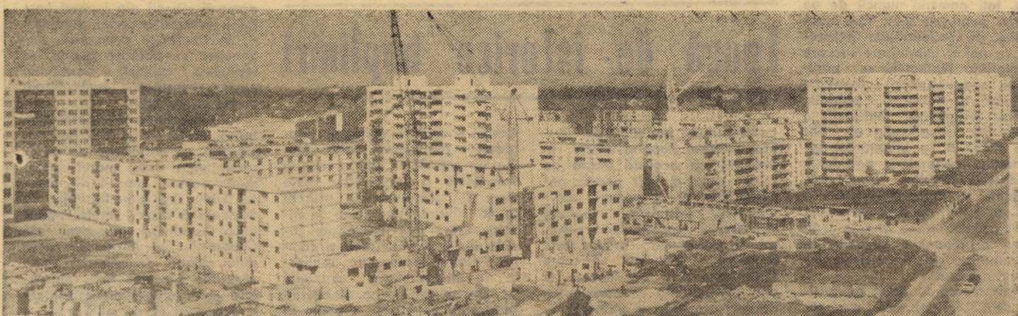
O imagine simbolică pentru vocația de cititor a poporului român