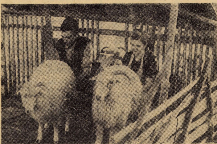
Mulsul oilor la o stînă din Poiana Sibiului, acțiune încheiată zilele trecute