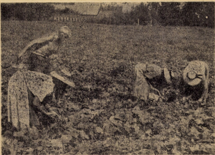
Pe terenurile Fermei nr. 4 Cristian a Asociației economice legumicole Sibiu se recoltează ultimele cantități de castraveți

Această asigurare se poate încheia prin agentii de asigurare care se deplasează la domiciliul cetățenilor, prin inspectorii de asigurare, responsabili cu munca ADAS din comune și întreprinderi sau direct la unitățile ADAS din Sibiu, Medias și Agnita.