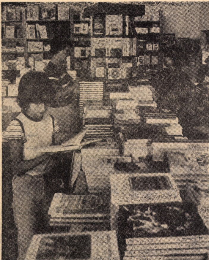
...Și la Cisnădie drumul spre cartea din biblioteca personală trece prin Librăria nr. 1 — unitate unde noutățile editoriale atrag din ce în ce mai mulți cumpărători