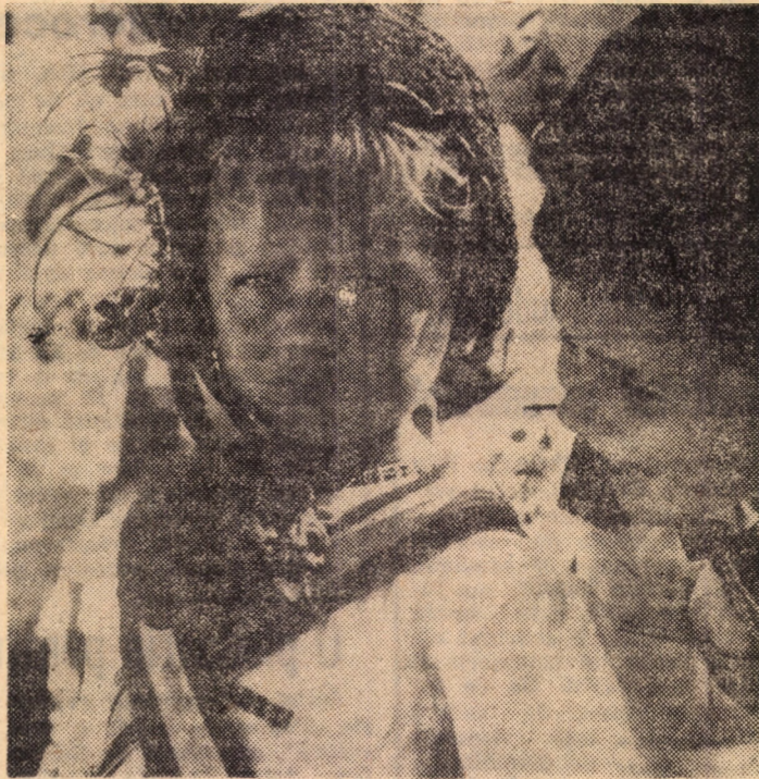
„Voi fi și eu vâtaf de călușeri!”

Dintre toate, grefa de rinichi prezintă cel mai mare coeficient de reușită. • Maratonul de dans desfășurat în orasul canadian Norand a fost câștigat de o pereche care a dansat 140 ore și 9 minute. Halal distracție! (n. i. d.).