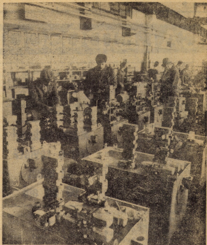
Montajul panourilor de acționare hidropneumatică la întreprinderea „Balanta II” din Sibiu.

Cooperatori! Mecanizatori! Oameni ai muncii din agricultură, locuitori ai satelor! Mobilizați-vă exemplar forțele, participați cu toate mijloacele, cu toată puterea de muncă, din zori și pînă seara, la strînsul și depozitarea în cele mai bune condiții a întregii recolte. Nu precupețiți nici un efort pînă ce întreaga producție nu va fi pusă la adăpost, pînă ce ultima cantitate de sămînță planificată pentru toamna aceasta nu va fi încorporată sub brazdă!