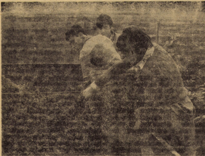
„La încărcat e mai greu”, par să spună băieții din fotografie, elevi ai Școlii generale din Moisei (Maramures). Acestia, au deprins totuși repede „tehnica” recoltării strugurilor, iar acum țin pasul cu mai „experimentații” lor colegi din Dobirca