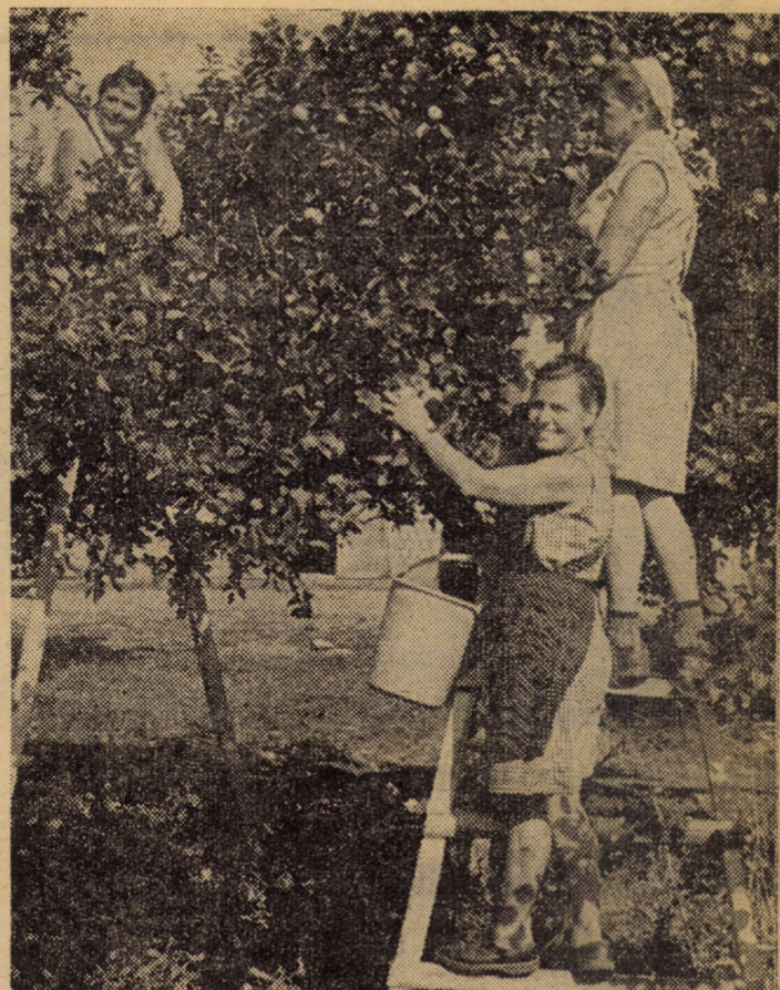
La ferma pomicolă a I.A.S. Ruja producția de fructe din acest an este deosebit de bogată. La recoltări sunt antrenati zilnic zeci de lucrători I.A.S. și elevi.