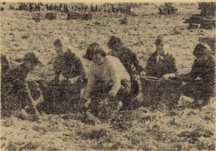
Citeva dintre elevele clasei a XI-a A de la Liceul sanitar la lucrările de recoltare a legumelor