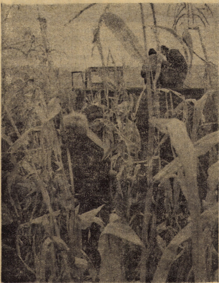
Flux continuu la recoltatul porumbului