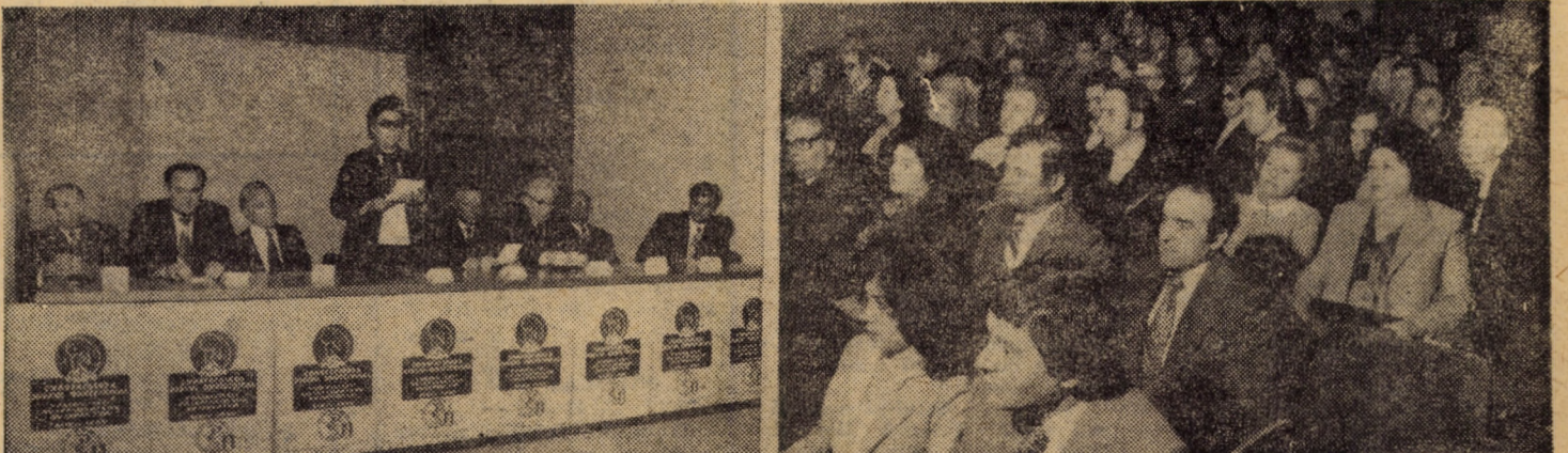
Aspect din sală, de la Consfătuirea națională de obstetrică și ginecologie