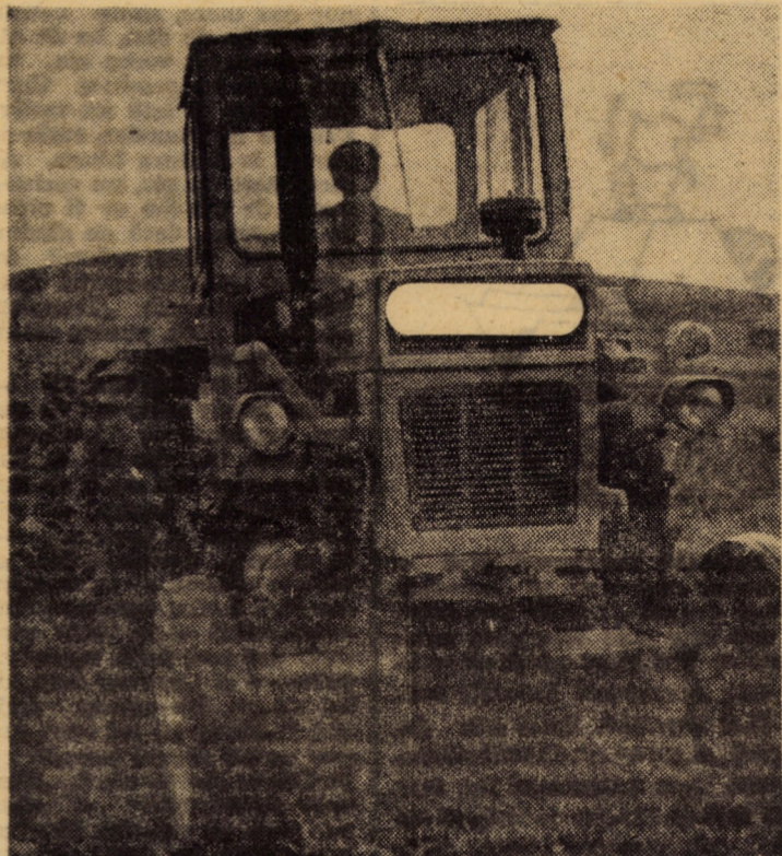
O lucrare de mare importanță în aceste zile: arături adînci de toamnă. În imagine secvență de la C.U.A.S.C. Nocrich