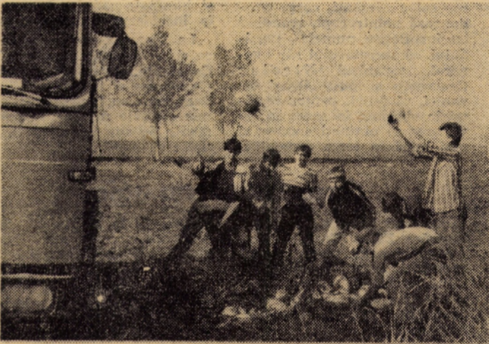
Prezenți pe terenurile fermei nr. 4 a I.A.S. Șura Mică, elevii liceului industrial „Independența” sprijin activitatea de transport a rădăcinoaselor furajere din cîmp

În acest mod, „Ziua recoltei”, va fi și în județul nostru nu doar o zi de sărbătoare, ci și un nou prilej de manifestare a hărniciei și abnegației, a dăruirii și spiritului gospodăresc al tuturor celor ce muncesc pe ogoare, pentru mai binele și belșugul țării.