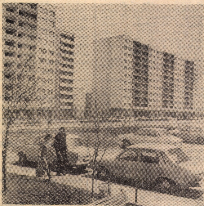
Zile de toamnă în cartierul sibian Hipodrom