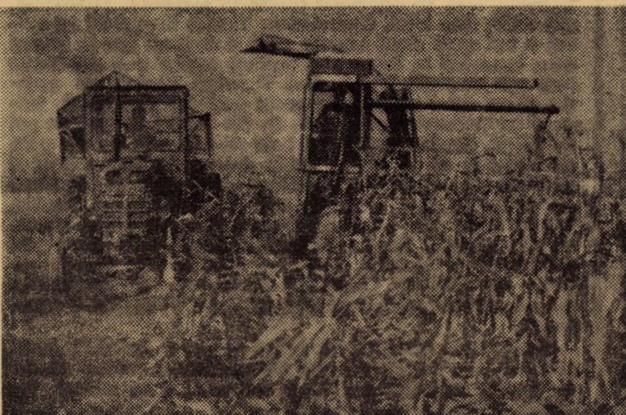
Imediat ce porumbul a fost cules, trebuie să se treacă și la recoltarea cocenilor pentru a se crea front de lucru plugurilor.

În unitățile din municipiile Sibiu și Mediaș, în orașele Cisnădie, Copșa Mică, Agnita se vor pune în vânzare importante cantități de varză albă, morcovi, pătrunjel, păstîrnac, sfeclă roșie, ridichi de iarnă, tomate și castraveți de seră, mere și alte fructe. De asemenea se vor mai pune în vânzare, prin transfer din alte județe importante cantități de ardei, gogoșari, vinete, conopidă.