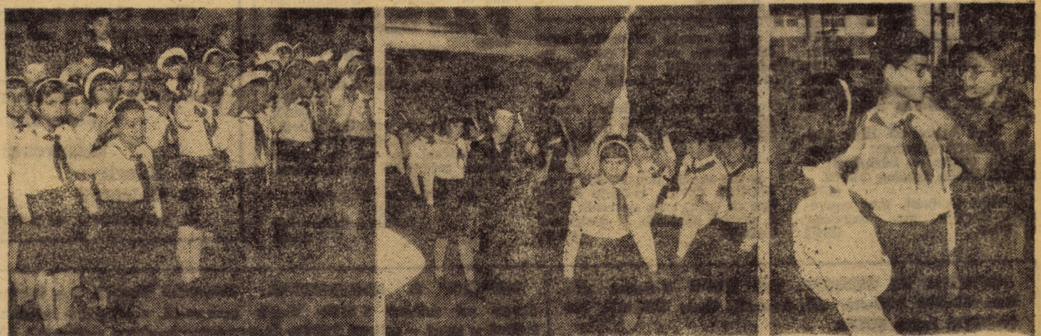
În aceste zile, în școli se desfășoară adunările pionieresti de alegeri. Redăm secvențe de la o astfel de acțiune a celor 340 de reprezentanți ai pionierilor de la Școala generală nr. 15 din Sibiu

discut cu E. Arion, lucrător gestionar. Încerc doar pentru că de discutat cu dînsul n-a