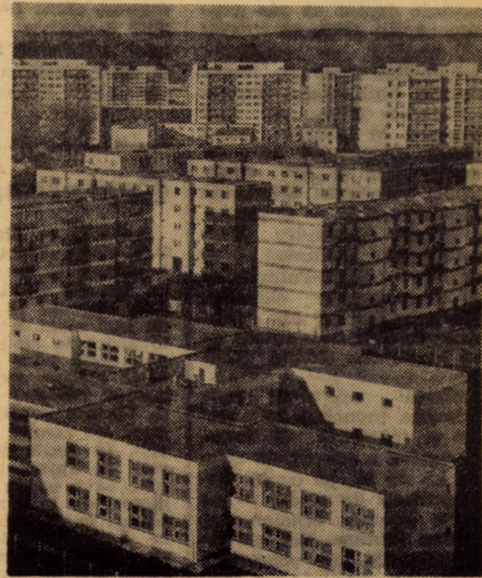
Panoramic. Hipodrom III, Sibiu

a partidului, rezultate remarcabile pe măsura muncii și eforturilor depuse.