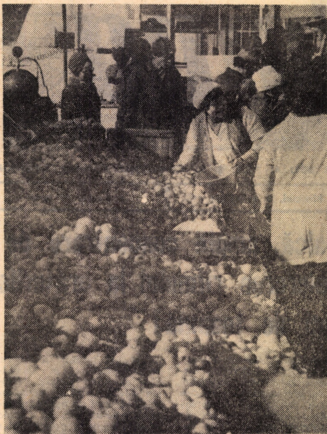
În Piața Cibin din Sibiu se pun în vânzare zilnic mari cantități de fructe. Iată un aspect din expozițiile organizate de Complexul comercial Gostat

Iată și laureații ediției din acest an a festivalului: Premiile speciale ale juriului: Corul sindicatului „Textila”, Grupul folk „Primii zori”, Fanfara Casei pionierilor și șoimilor patriei Cîsnădie; Formații corale — Corul german al Casei de cultură a sindicatelor; Formații instrumentale — Fluierași din Sadu și Fanfara Casei de cultură a sindicatelor; Formații vocal-instrumentale — Grupul „Alfa”; Formații coregrafice — Formația de dans modern „Ritmîc” a casei de cultură a sindicatelor și echipa de dansuri germane a căminului cultural din Cîsnădioara; Brigăzi artistice — „Mătasea roșie” Cîsnădie. Au mai fost acordate premii grupurilor și interpreților de satiră și umor, soliștilor vocali și instrumentiști. Marele premiu al festivalului, „Mărul de aur”, a fost acordat Stațiunii de cercetare și producție pomicolă Cîsnădie, pentru cea mai bună — cantitativ și calitativ — producție de mere (în anul 1982) de la înființarea acestei unități. (O.R.).