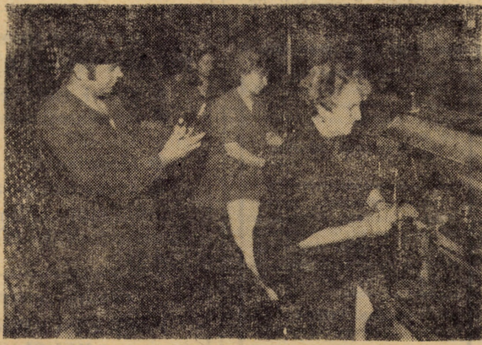
Controlul final al produselor din sticlă la întreprinderea „Vitrometan” Mediaș