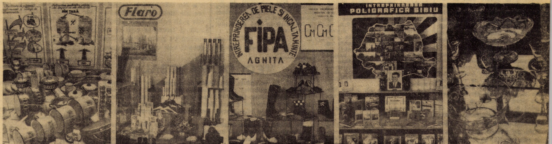
Cîteva imagini din expoziția realizărilor economiei județului