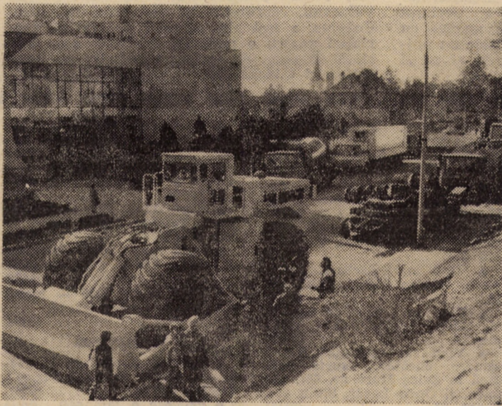
Expoziția realizărilor economiei județene - o permanentă atracție pentru vizitatori

„Cine trece fără frică / Prin-tre potere și flinte? / Este Nae