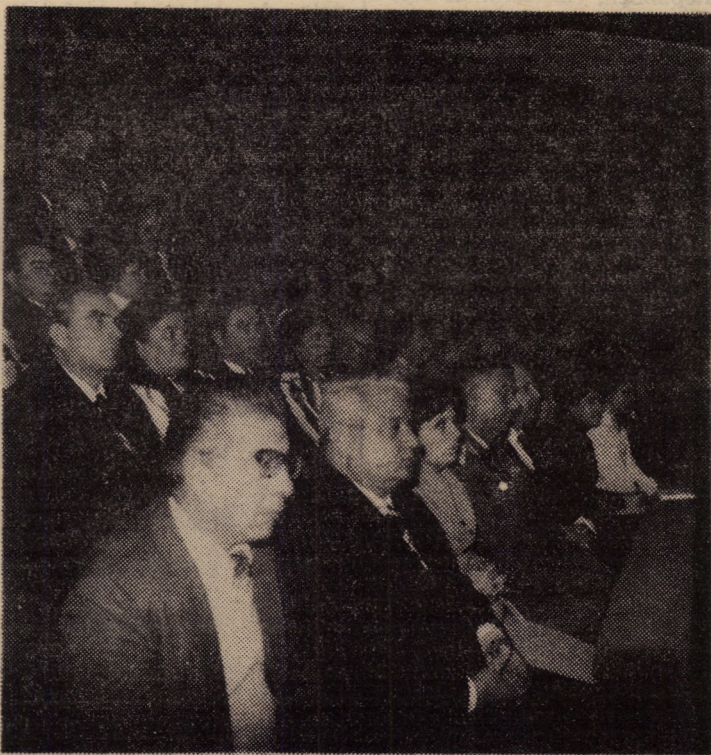
Aspect din sală, din timpul lucrărilor Conferinței Naționale a partidului