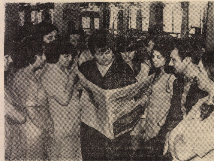
Și la întreprinderea „Steaua roșie” din Sibiu, Raportul tovarășului Nicolae Ceaușescu la Conferința Națională a partidului a fost primit de întregul colectiv cu un larg și puternic interes. Imaginea aceasta a fost surprinsă în atelierul de confecționat costume, într-una din pauzele de masă.

Erou al Muncii Socialiste, directorul Întreprinderii de geamuri Mediaș