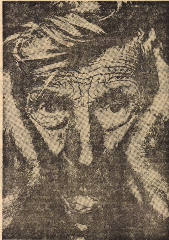
Istvan Toth - E. FIAP (Ungaria) „It was a hardy way”

• 24 de țări participante • 1200 lucrări alb-negru și color • 202 cuprinse în expoziție • 22 premii