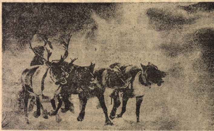
Serghei Voronin (U.R.S.S.)