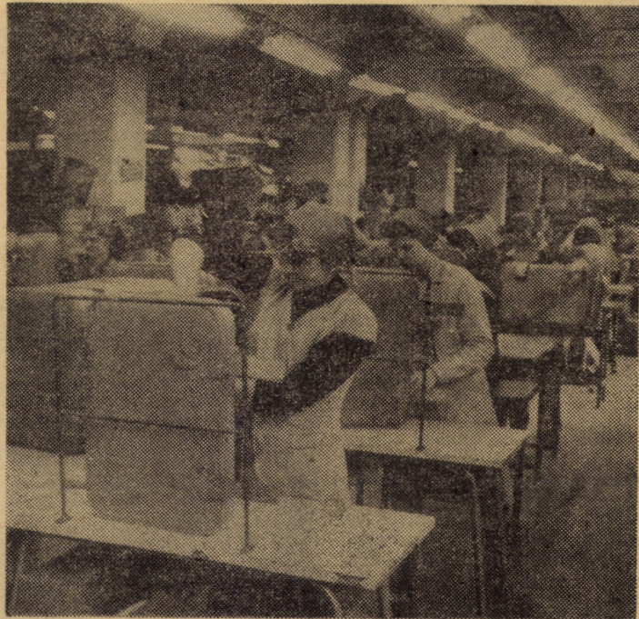
Harnicul colectiv de muncitori din atelierul de confecționat valize - formația de lucru nr. 18 a întreprinderii „13 Decembrie” - întimpină cea de-a 35-a aniversare a Republicii cu noi realizări de prestigiu

De remarcat că ponderea producției de export în totalul producției de aparate de măsură și control a atins în acest an 25 procente.