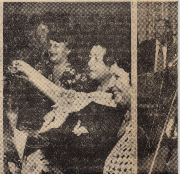
Noaptea de hotar a anilor... veselie, voie bună, urări de bine și noroc, gânduri, proiecte de viitor...