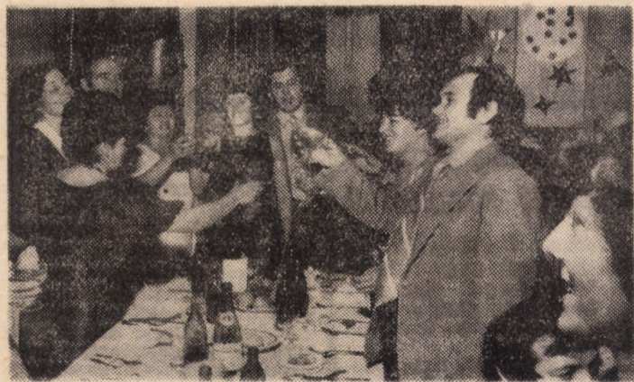
Revelion '83 la Casa de cultură a tineretului din Sibiu, unde tineretea, veselie și voia bună și-au dat din nou mina