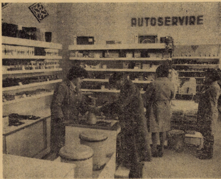
Instantaneu în magazinul de articole electro-casnice al complexului comercial din Ocna Sibiului.

Ferma I Viile Sibiului a I.A.S. Dealul Ocnei a încheiat anul 1982 cu rezultate mult peste nivelul celorlalte ferme de profil din întreprindere. Concomitent, și-a asigurat o bună bază furajeră. Făcînd bilanțul primelor 3 zile ale anului în curs observăm că s-au realizat cu cîte 600 litri de lapte mai mult decît sarcinile zilnice pe luna ianuarie. În ce privește intențiile de viitor, iată opinia inginerului Octavian Marțian, șeful fermei: „Paralel cu sporirea producției de lapte, îmbunătățirea indicelui de natalitate, mărirea sporului în greutate, ne vom ocupa sistematic de sporirea producției de furaje. La efectivul și rasa de animale pe care le deținem trebuie să asigurăm la o vacă în plină lactație peste 15 UN în rații echilibrate, bogate în săruri minerale și vitamine. În Mesajul de Anul Nou, președintele țării ne-a cerut să facem totul pentru a da economiei naționale producții cât mai mari. Colectivul nostru a înțeles că avem toate condițiile (animale de înaltă valoare zootehnică adaptate la mediu, adăposturi modernizate, îngrijitori de înaltă calificare) pentru ca începînd cu 1983 să sporim producția pe vacă furajată cu minimum 2 000 litri anual. Pentru asta nu avem nevoie de nici un fel de investiții, ci doar de furaje, cît mai multe și cît mai bune. Și cum tot noi ne ocupăm de furaje, ne vom strădui să le realizăm...”