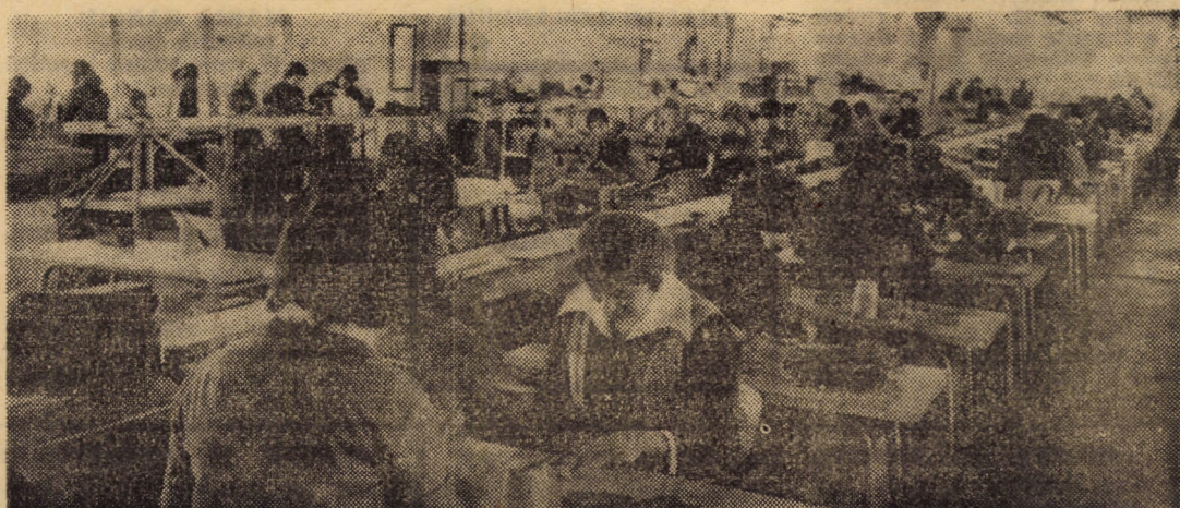
Deși înființată recent, unitatea de marochinărie din Săliște, aparținînd întreprinderii „13 Decembrie” Sibiu, s-a înscris cu bune rezultate în circuitul industrial al județului Sibiu.