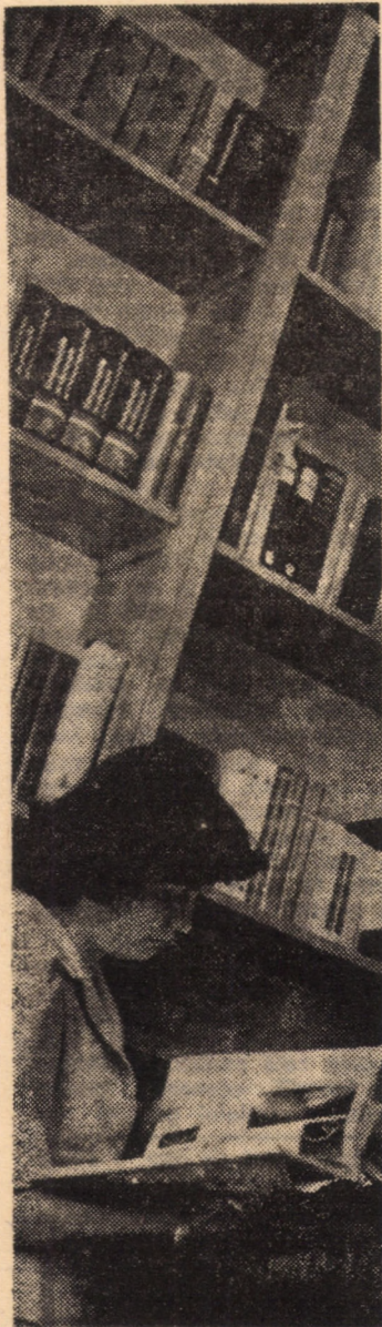
Fondul bogat de cărți și reviste de specialitate al bibliotecii U.S.S.M., filiala Sibiu (bibliotecă Rodica Popa) atrage, de la an la an, tot mai mulți cititori.