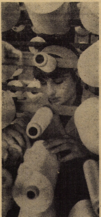
Buna pregătire a cadrelor din industria textilă, asigurată fie prin școli profesionale, fie prin calificare la locul de muncă, se reflectă în obținerea unor produse de calitate superioară

● Momentul Eminescu (133 de ani de la naștere) ● Văzute, citite, auzite ● O reușită seară cultural-distractivă pentru tineret ● Sport.