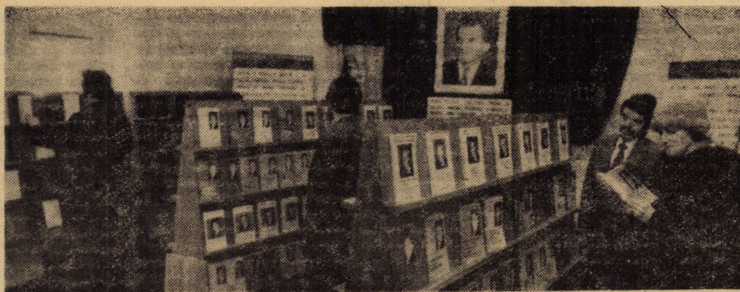
În șirul manifestărilor consacrate omagierii a 50 de ani de activitate revoluționară a tovarășului Nicolae Ceaușescu și aniversării zilei sale de naștere, Centrul județean de librării și Biblioteca „Astra” au organizat la Casa de cultură a studenților din Sibiu, expoziția „Din opera secretarului general al partidului, președintele României, tovarășul Nicolae Ceaușescu”.