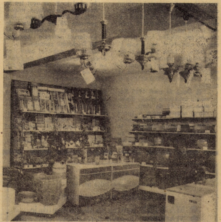
Raionul jucării și articole electro-casnice al complexului comercial din Copșa Mică, recent dat în folosință.

președinte al Consiliului județean Sibiu al Organizației pionierilor