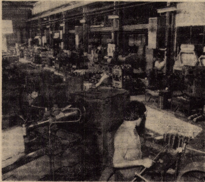
Aspect din hala secției strungăria ușoară a întreprinderii „Independența” Sibiu unde muncesc o bună parte din tinerii acestei unități