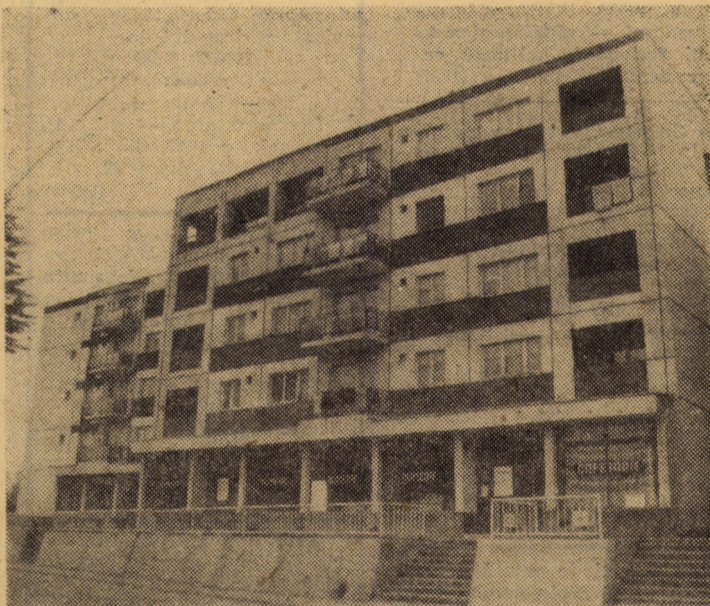
Arhitectonică modernă în așezările județului nostru. Blocuri de locuințe, cu magazine la parter, în Medias.

Iată dar doar cîteva probleme care figurează pe agenda de lucru a consiliului popular al orașului Ocna Sibiului, a biroului său, probleme permanente sau sezoniere, probleme de rezolvare cărora depinde în mare măsură realizarea sarcinilor ce-i revin consiliului popular care, firesc, sub conducerea comitetului orășenesc de partid, depune eforturi pentru ca orașul să fie și frumos și bogat.