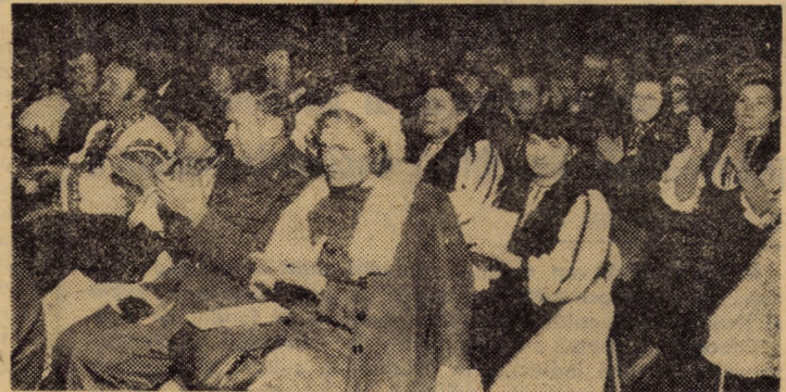
Aspect din sală în timpul Conferinței