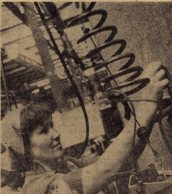
„Dumbrava” Sibiu — o întreprindere cunoscută și apreciată pentru calitatea covoarelor pe care le realizează. Înainte de a fi livrate beneficiarilor în secția repasat se verifică și remediază cu mare atenție orice defecțiune de fabricație, oricât de mică ar fi