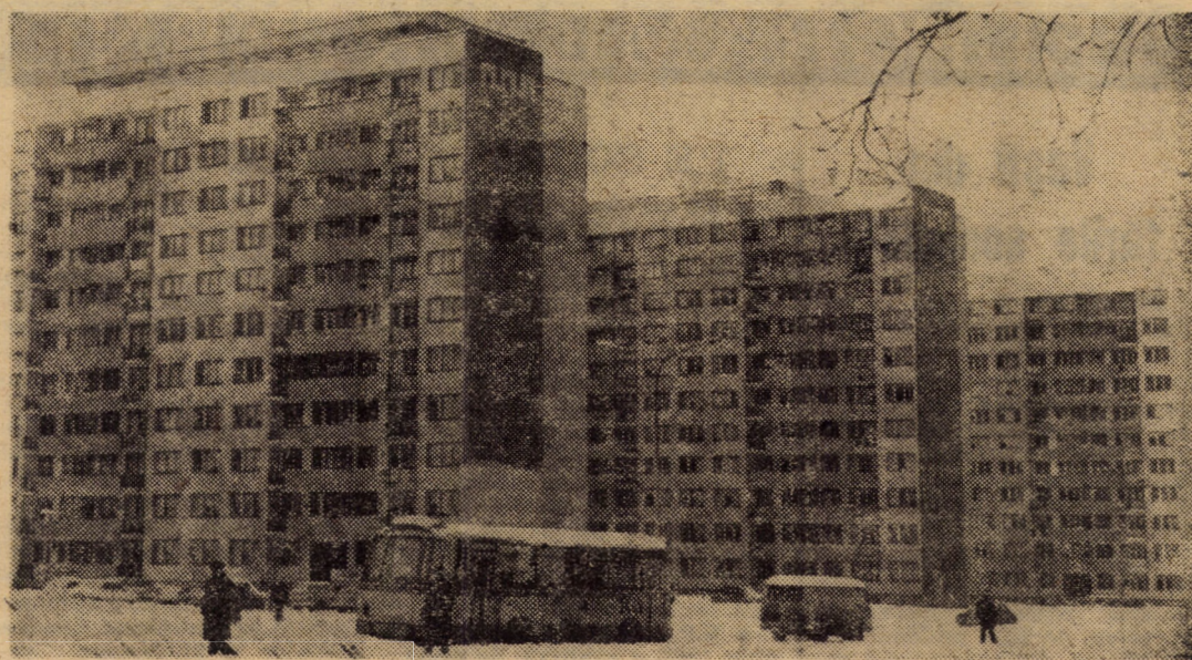
Iarna a prins ultimul tren și iot-o sosind și pe străzile noastre