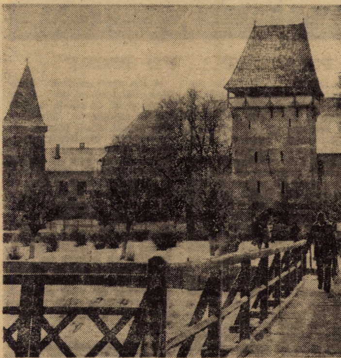
Și la Agnita iarna își reclamă „drepturile legitime“, iar această imagine a orașului vechi stă parcă mărturie temeiniciei muncii înfrățite a românilor și germanilor din oraș

Ținînd cont de stadiul actual al realizării contractelor, în următoarele două-trei zile trebuie să se acționeze energic, susținut, eficient, în vederea