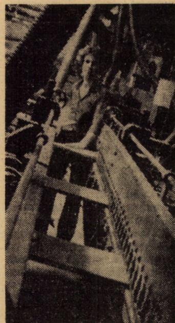
La Fabrica de mobilă din Mediaș prelucrarea subsansamblelor de mobilă se realizează cu ajutorul unor utilaje de înaltă tehnicitate, asigurându-se astfel o calitate înaltă produselor